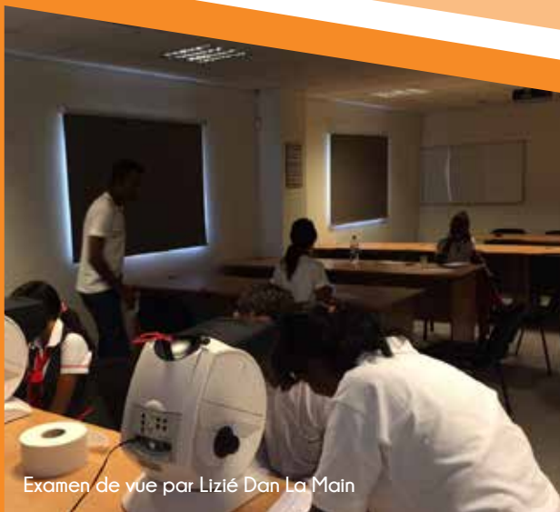
Examen de vue par Lizié Dan La Main

Cette semaine incontournable a été organisée en partenariat avec plusieurs ONG, dont Open Mind, Link to Life, Lizié dans la main, la Blood Donors Association, mais aussi avec le soutien du ministère de la Santé.