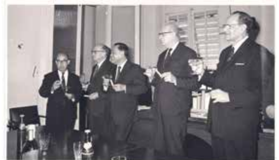
Mauritius Union Assurance Co. Ltd. - Silver Jubilee - 26th July 1973

De plus, depuis 1976, nous sommes dans le secteur de l'assurance. Nous représentons la Mauritius Union Assurance à travers notre agence Good Harvest Ltd, qui est primée année après année pour son apport dans l'assurance des véhicules.