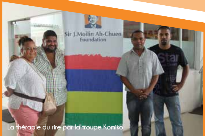
La thérapie du rire par la troupe Komiko