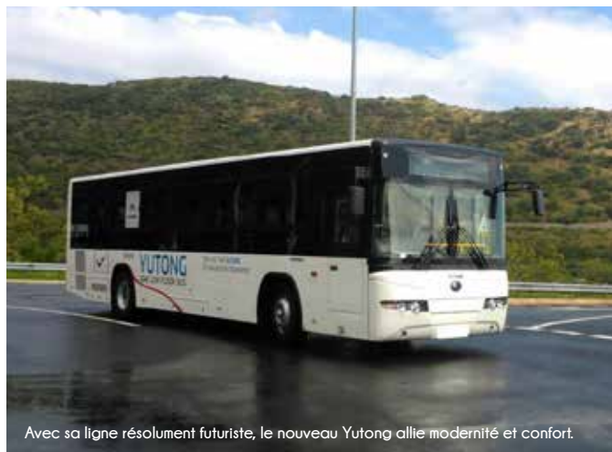
Avec sa ligne résolument futuriste, le nouveau Yutong allie modernité et confort.

Il n'est un secret pour personne que le transport en commun est appelé à évoluer drastiquement dans les prochaines années.