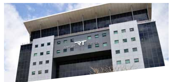
ABC Global et ABC Capital Markets sont situés à Raffles Tower, Ebene