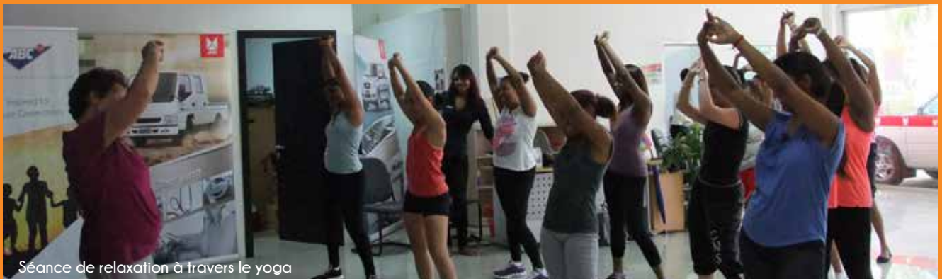
Séance de relaxation à travers le yoga