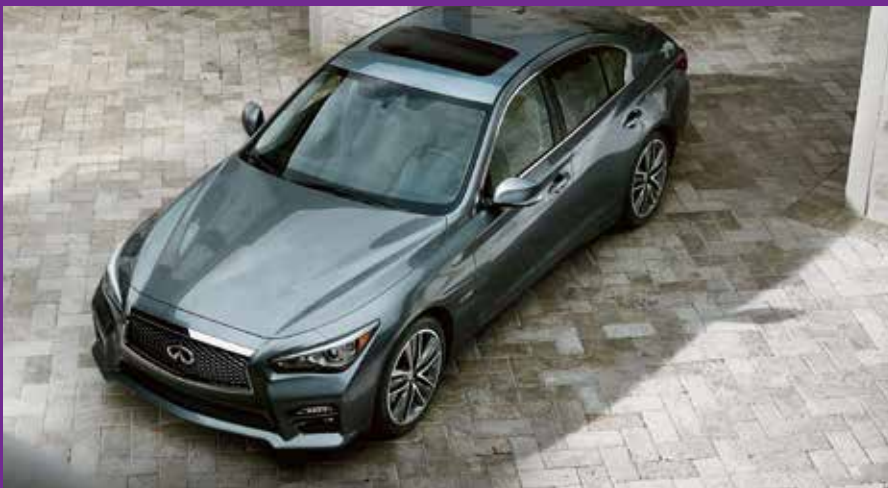
La superbe et innovante Infiniti Q50

En sus de la récente introduction de la nouvelle Infiniti Q50 et de l'exposition de l'édition Premium S de l'Infiniti QX70, la luxueuse marque automobile a profité de l'Engen Motorshow 2014 pour dévoiler un nouveau mode de dénomination pour ses modèles futurs et existants.