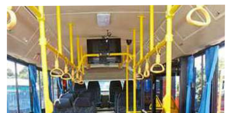
Le bus est doté d'écrans plats qui permettent aux passagers de s'évader en admirant autre chose que le paysage.

connection wifi, les prises USB pour charger les téléphones portables mais aussi sa conduite fluide et silencieuse, le nouveau Yutong est tellement confortable que certains ont du mal à résister à une petite sieste pendant le trajet. Une chose est sûre : ce bus incarne une alternative plus que bienvenue aux vieilles carlingues qui encomrent et polluent nos routes.