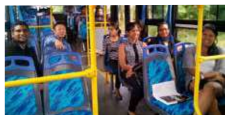
Le « Marketing & Advertising Committee » de ABC Automobile s'est fait un plaisir de tester le nouveau Yutong.

Avec ses deux télévisions à écran plat à l'intérieur, la climatisation, la