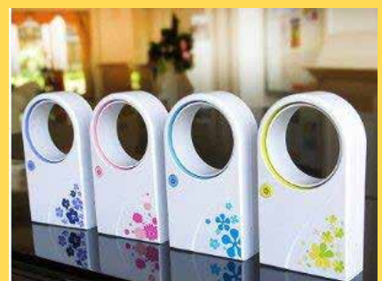
Les ventilateurs en provenance de Chine distribués par PBTH.

Les produits sont en vente dans le magasin agence de PBTH, au 2ème étage de ABC Centre. Un tarif préférentiel est pratiqué pour les employés du groupe ABC.