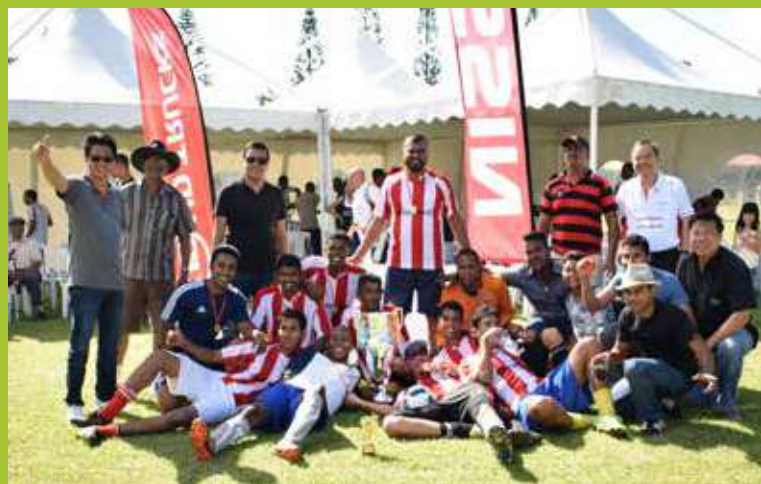
Les champions du tournoi d'ABC Automobile.