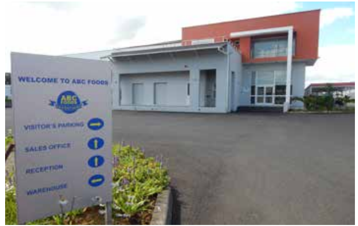
ABC Foods distribue les biscuits Bakers depuis 1957.

Article publié dans la 106e édition de Lifestyle, publication de Business Magazine.