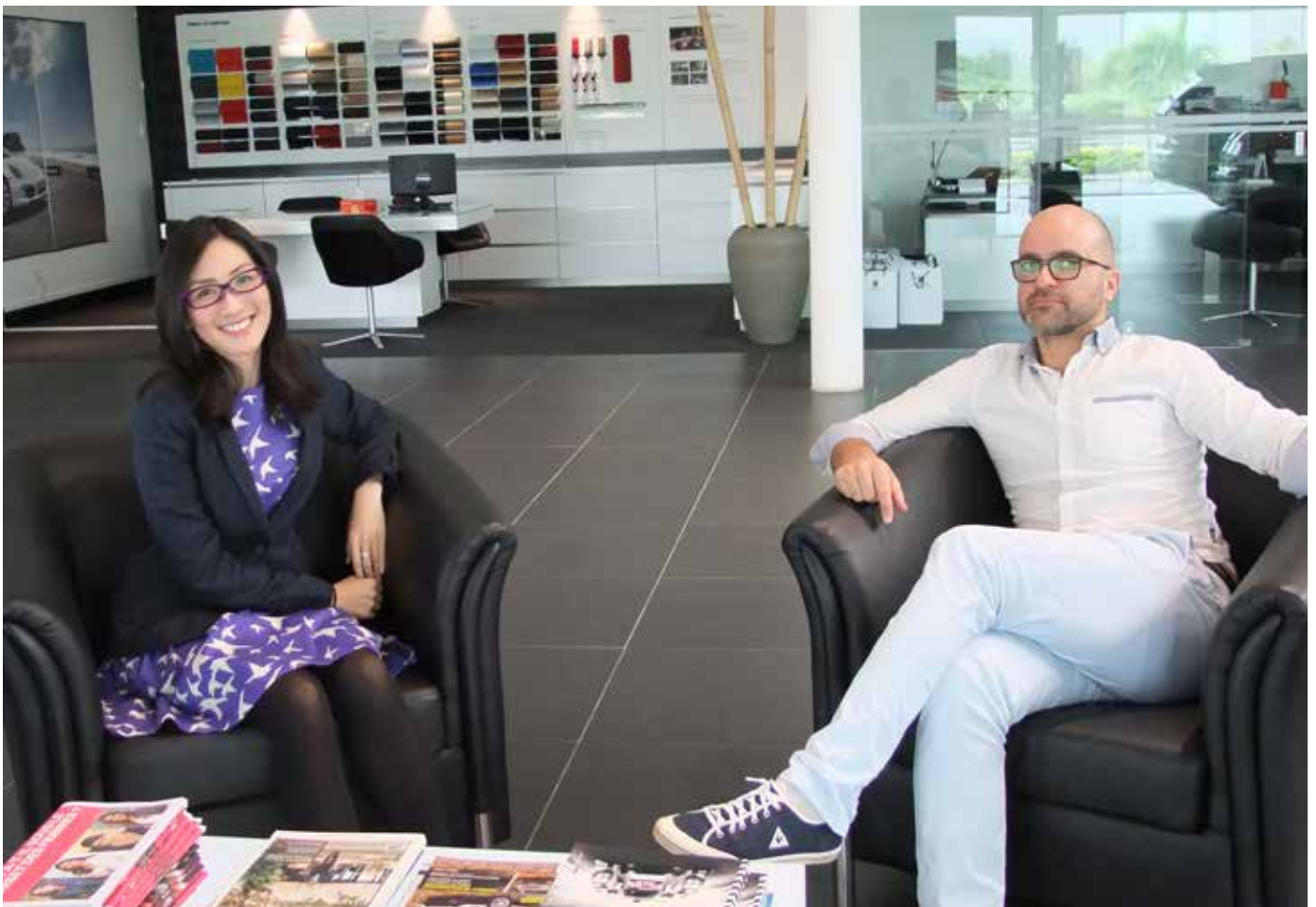
Note de la rédaction : Propos traduits pour les besoins des lecteurs.