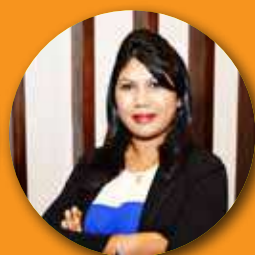
HEMA ESSEEA ABC Banking Corporation